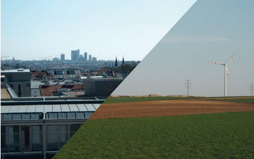
Stadt und Land im Wandel

AKADEMISCHE* R EXPERT* IN FÜR KOOPERATIVE STADT- UND REGIONALENTWICKLUNG MASTER OF ARTS (MA)