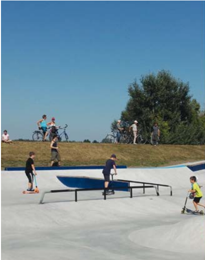
Die soziale Region

AKADEMISCHE* R EXPERT* IN FÜR KOOPERATIVE STADT- UND REGIONALENTWICKLUNG MASTER OF ARTS (MA)