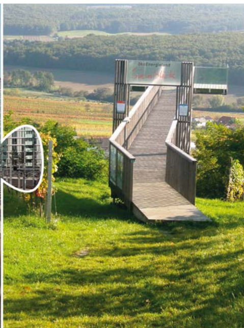
Die nachhaltige Region