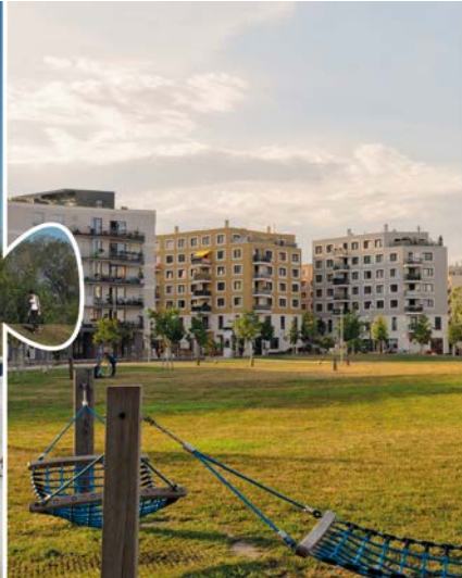
Die smarte Region