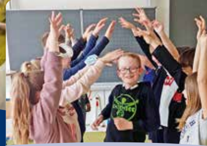
[22] Achtsamkeit mit Kindern