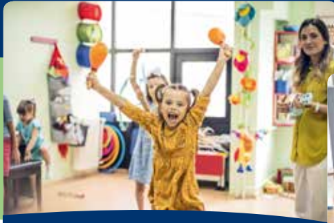
[4] Psychomotorische Lehr- und Lernmethode